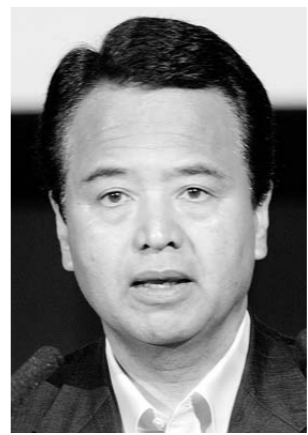
経済産業大臣 甘利 明氏

世界経済におけるアジアのプレゼンスが高まっている。中でも、アジアのハブとして存在感が増している東南アジア諸国連合(ASEAN)は、八月八日に設立四十周年を迎えた。このことを記念したシンポジウム「グローバル化時代の日本ASEAN経済関係」が、主催者として日本アセアンセンター、日本経済新聞社が中心となり開催され、日本とASEAN加盟十カ国から多数の有識者が参加した。日本、ASEAN双方の参加者から、今後の新たな関係の構築に向けた活発な議論が展開された。