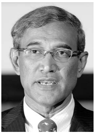
シンガポール外務担当 上級国務大臣 ザイナル・アビディン・ラシド氏

経済関係を構築することが可能になる。二点目は、ASEAN全体との包括的経済連携(AJCEP)協定の締結を目指している点だ。単純な二国間の貿易・投資関係を越え、高度な国際分業体制を確立している日系企業や、中国・韓国企業との競争で劣位に置かれたくないよう、十一月の日本ASEAN首脳会合までの受給を指し交わしている(注)。 三点目は、アジア資源国とのEPAに、エネルギーに関する独立した章を盛り込んでからなる東アジア包括的経済